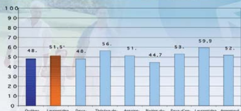
Population active et modérément active durant les loisirs (12 ans ou plus, 2003)

* différence statistiquement significative avec la région ** différence statistiquement significative avec le Québec