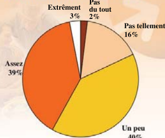
Niveau de stress au travail (excluant les bénévoles)